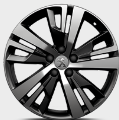
חישוקי סגסוגת 18" DETROIT שני גוונים במארג יהלום סטנדרט לדגמי ACTIVE ו-PREMIUM