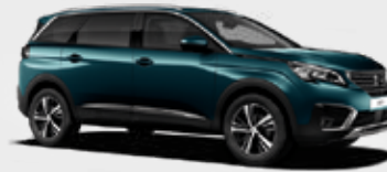
כחול קריסטל מטאלי | DZM0 | Emerald Crystal