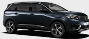
כחול כהה מטאלי | T4M0 | Bourasque