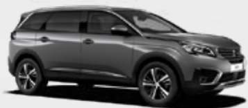
אפור פלדה מטאלי | F4M0 | Gris Cumulus