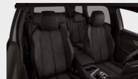
מושבים בריפוד עור מלאכותי משולב אלקנטרה