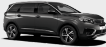
אפור פלטיניום מטאלי | VLM0 | Gris Platinum