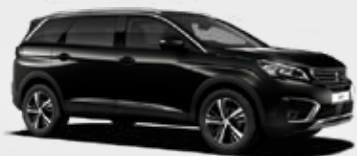
שחור מטאלי | 9VM0 | Noir Perla