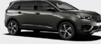
ירוק אמזון מטאלי | KLM0 | Gris Amazonite