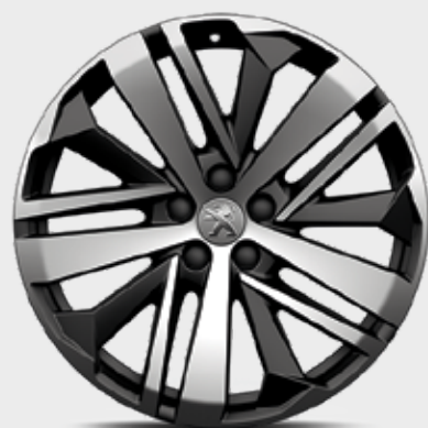
חישוקי סגסוגת 19" BOSTON שני גוונים במארג יהלום סטנדרט לדגמי GT