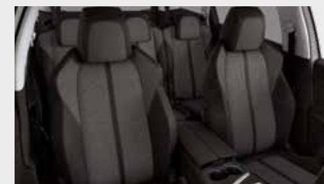
ריפוד פנימי וגימור דלתות בצבע אפור כהה