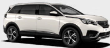
לבן פנינה | M6N9 | Noir Nacré