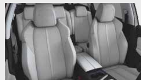
ריפוד פנימי וגימור דלתות בצבע אפור בהיר